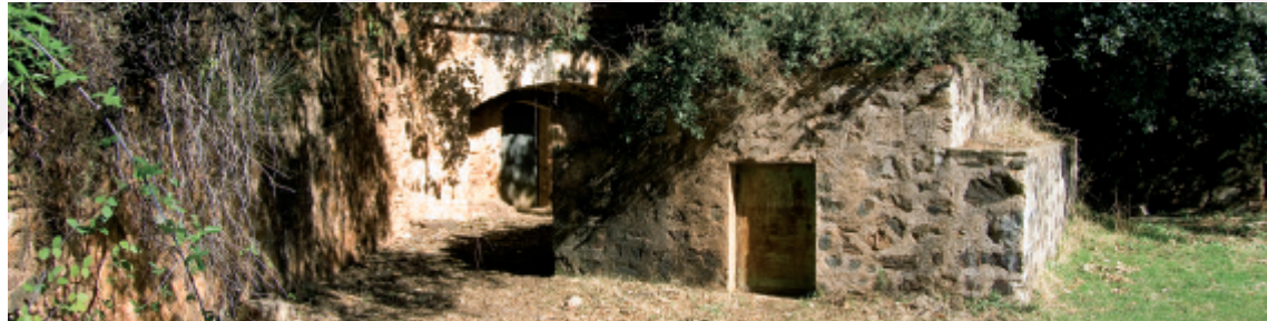
Depósito exterior o arca (centro) y acceso a las minas (fondo)

Los materiales que constituyen el subsuelo de la vertiente sureste de la sierra de la Villuerca son capas de cuarcitas, areniscas y pizarras muy fracturadas, consideradas rocas permeables o semipermeables. Sobre estas rocas se encuentran las pedreras de los Hollicios, formadas por grandes fragmentos angulosos de cuarcitas que presentan una elevada permeabilidad, infiltrándose el agua de las precipitaciones a través de los numerosos huecos existentes entre estos bloques rocosos (zona de recarga). Después de pasar por las pedreras, el agua se filtra por las fracturas de los materiales del subsuelo y desciende a grandes profundidades, siendo recogida mediante excavaciones subterráneas llamadas galerías colectoras o minas de agua . En ocasiones, el agua subterránea puede salir por sí sola al exterior, creándose manantiales o fuentes de ladera, llamados en la comarca "bohonaes" o "trampales", como los que se encuentran cercanos a