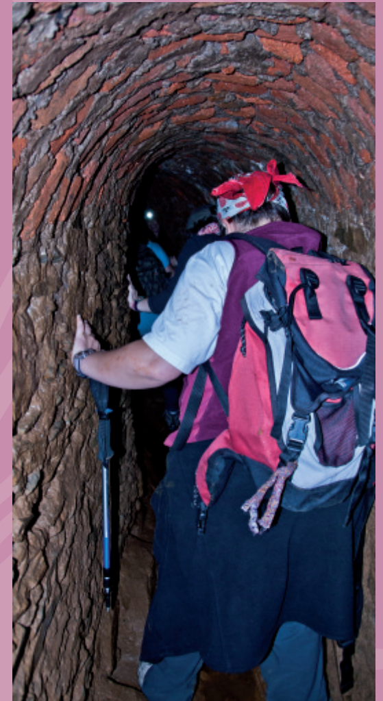
Visita a las galerías de captación de la mina

Red de distribución hacia las numerosas fuentes del pueblo, huertas y monasterio de Guadalupe.