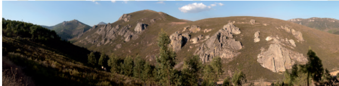
Afloramientos cuarcíticos en el desfiladero del Ruecas

El encajamiento del Ruecas entre las duras cuarcitas armoricanas ha sido posible gracias a la erosión fluvial sobre una larga falla tectónica que recorre el fondo del tajo, con dirección SE-NW, dividiendo en dos partes el apretado anticlinal de Cañamero, cuyos estratos cuarcíticos plegados se observan en el risco de las Cuevas. Este estrecho anticlinal se prolonga desde aquí hasta las Apreturas del Almonte pasando por sitios de interés geológico como la sierra de la Madrila en Cañamero, los canchos de las Sábanas en Berzocana, el cancho del Reloj de Solana y el Castillo de Cabañas, sirviendo, junto con el discontinuo sinclinal de Cañamero-Sierra de Berzocana, de límite occidental a la gran megaestructura tectónica del sinclinal de Santa Lucía-Río Ruecas, en su contacto, mediante falla inversa, con las pizarras precámbricas del gran anticlinal de Logrosán (ver