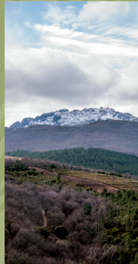
El risco de La Villuerca desde el valle del Ibor

El conjunto también sobresale por sus valores naturales, entre los que destacan enormes masas de bosque caducifolio de roble y castaño y numerosas especies de aves protegidas como el águila real, halcón peregrino, buitre leonado, alimoche, búho real, roquero solitario, acentor alpino, cigüeña negra, etc.