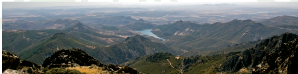
Vistas del valle del Rucas desde la cima del risco de La Villuerca

Con sus 1601 metros de altura se trata del risco culminante del sistema montañoso del Geoparque. Éste se presenta como un núcleo orográfico rodeado de antiguas penillanuras y constituido por una serie de sierras y valles paralelamente alineados con dirección noroeste-sureste, plegado durante el movimiento orogénico Hercínico (hace entre 370 y 230 millones de años), arrasado por la erosión a lo largo de las eras mesozoica (entre 230 y 65 m.a.) y cenozoica (65 m.a. hasta la actualidad) durante la que se ve también rejuvenecido por fracturación a lo largo del movimiento orogénico Alpino. Finalmente, el encajamiento de la red fluvial actual en este territorio ha configurado la principal característica geomorfológica de la comarca, que suele denominarse relieve apalachense por analogía con las formas que se encuentran en los montes Apalaches de Norteamérica que también tienen como base una antigua cordillera hercínica. Su aspecto viene marcado por las areniscas y cuarcitas (Cuarcita Armoricana) que por su elevada resistencia a la erosión configuran el relieve abrupto de estas sierras y gran cantidad de derrubios de ladera conocidas como "pedreras". En estas series de cuarcitas armoricanas es frecuente encontrar pistas de Trilobites (crucianas) y galerías formadas